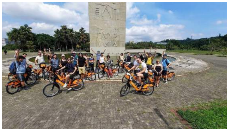
Os participantes do evento em visita técnica ao Aterro Sanitário da cidade de Guarulhos e na saída do passeio ciclístico.

O programa de São Paulo foi construído de maneira colaborativa entre o professor e mentor Fabio Kon e a turma de doutorandos da USP, buscando oferecer uma combinação de discussões teóricas de fronteira sendo desenvolvidas na pós-graduação da USP e em institutos associados, além