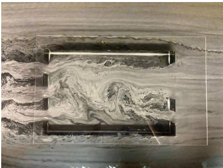
Ensaio na mesa d'água da FAUUSP durante sua inauguração na Semana de Ventilação Natural