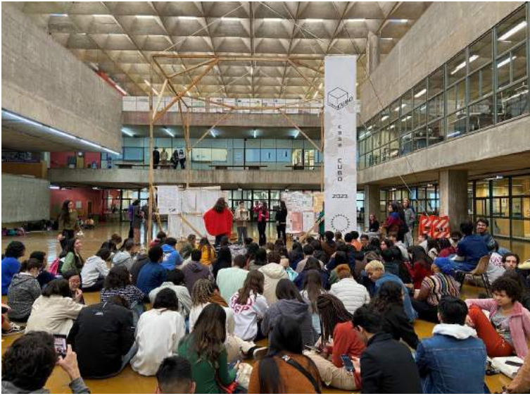
Exposição e apresentação dos trabalhos da Casa Cubo no Salão Caramelo da FAUUSP.