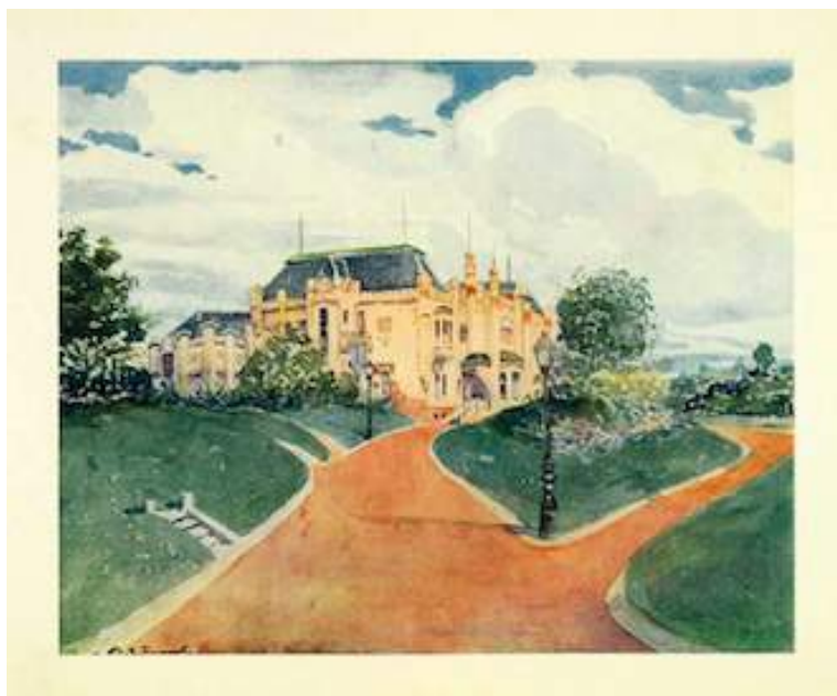
Figura 5 - Archibald Stevenson Forrest, Vila Penteadó , aquarela, 1912.