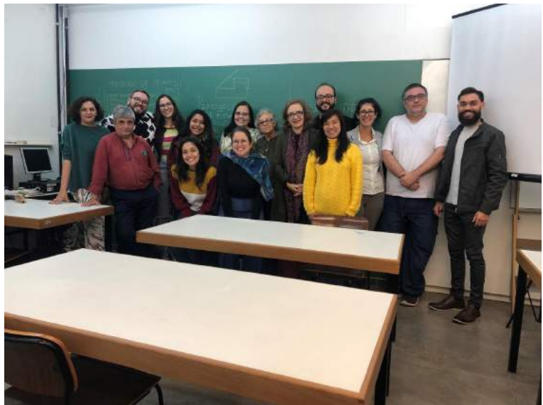
Semana da Ventilação Natural na FAUUSP

Por Profa. Alessandra Shimomura (AUT) e Profa. Michele Rossi (AUT)