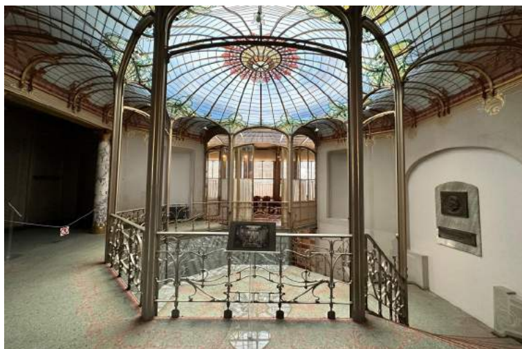
Figura 2 – Foto interna do Hôtel van Eetvelde do arquiteto Victor Horta, patrimônio mundial da UNESCO, onde foi realizada a palestra.