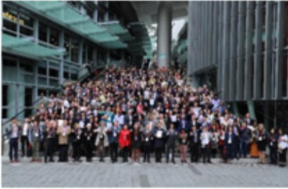
The Chinese University of Hong Kong (CUHK), local da conferência.