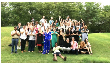
Participantes do Latitudes Global Studio 2018 em Ahmedabad, estudantes de graduação e pós-graduação da CEPT University em Ahmedabad, University of Westminster em Londres e FAUUSP em São Paulo, compondo um grupo de 20 nacionalidades diferentes.

Por fim, vale dizer que esse foi um evento bastante intenso no que se refere a atividades acadêmicas e troca não apenas de conhecimentos técnicos e metodológicos, mas principalmente de aprendizado acerca de uma cultura de fortes raízes modernistas e também vernacular.