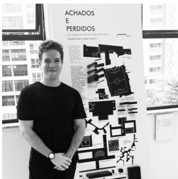
Durante a abertura da Biblioteca da Bienal.

“ACHADOS E PERDIDOS: um catálogo invisível da cidade de São Paulo” faz parte da 11ª Bienal de Arquitetura de São Paulo ficou em exposição na Biblioteca Mário de Andrade até 15 de Dezembro . Esta mostra também trouxe a publicação “6pages” publicada por Eduardo Pizarro em seu período de pesquisa na ETH Zurich.